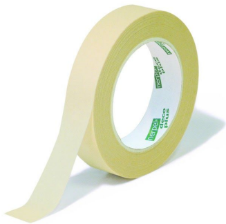
Cinta de pintor